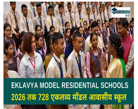
EKLAVYA MODEL RESIDENTIAL SCHOOLS 2026 तक 728 एकलव्य मॉडल आवासीय स्कूल

(C) हाल ही में केंद्र सरकार ने देश भर में 728 एकलव्य मॉडल आवासीय विद्यालय खोलने का लक्ष्य रखा है। इस योजना का मकसद आदिवासी बच्चों को बेहतर शिक्षा देना है। इस योजना के तहत 440 नए स्कूल बनाए जाएंगे और 288 पहले से चल रहे स्कूलों को अपग्रेड किया जाएगा।